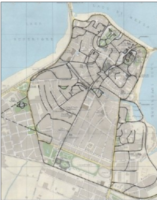
Illustrazione 2: Allegoria tratta a ricalco della mappa di Mantova.

Dov'è l'amor ch'io non vedo, nei due della mappa di Mantua? In colei dalla malcelata vergogna dell'ignuda accanto? O nel suo ventre che par sol della colpa, ma di lui ella indica decisa: per riparar l'oltraggio subito?