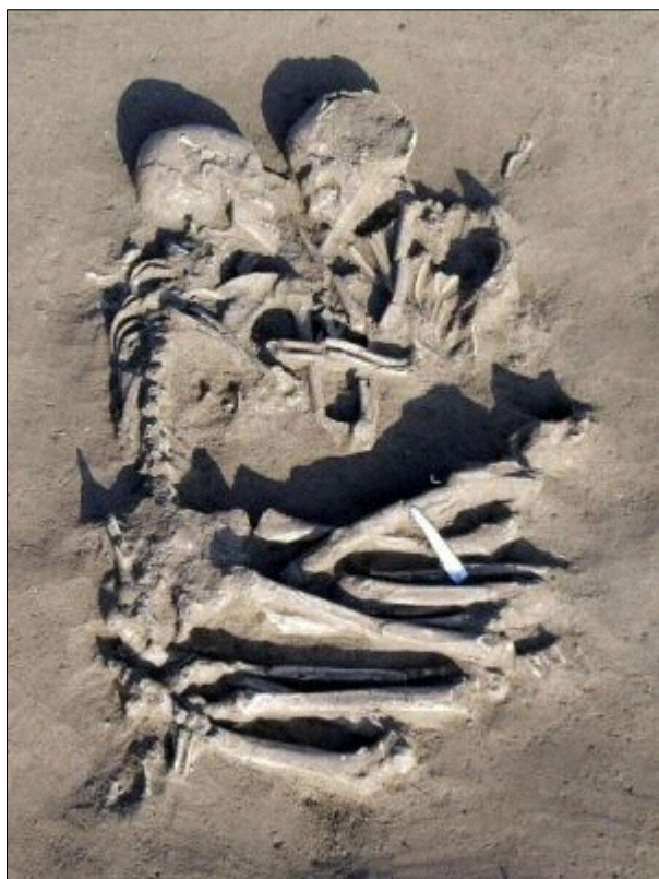
Illustrazione 1: Coppia di scheletri rinvenuti il 7 febbraio a Valdaro, alle porte di Mantova.

Un fatto di cronaca del 7 febbraio 2007: una sepoltura rinvenuta nel mantovano!